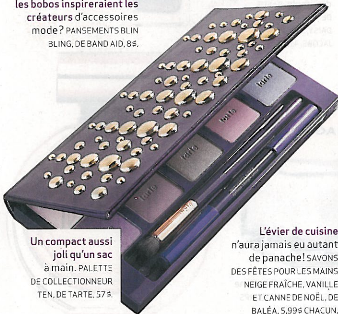
Un compact aussi joli qu'un sac à main. PALETTE DE COLLECTIONNEUR TEN, DE TARTE, 57$.