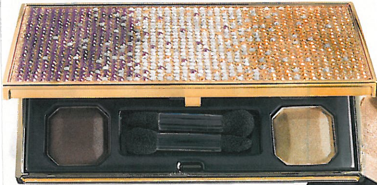
Les fashionistas s'arracheront cet ensemble multifards. PALETTE JINGLE BELLE, DE LISE WATIER, 38$.

Le mandat: jeter de la poudre aux yeux avec des produits habillés de dorures ou de strass. On affiche sans gêne son petit penchant pour l'ostentation.