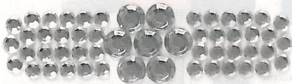
Qui aurait dit qu'un jour les bobos inspireraient les créateurs d'accessoires mode? PANSEMENTS BLIN BLING, DE BAND AID, 8$.